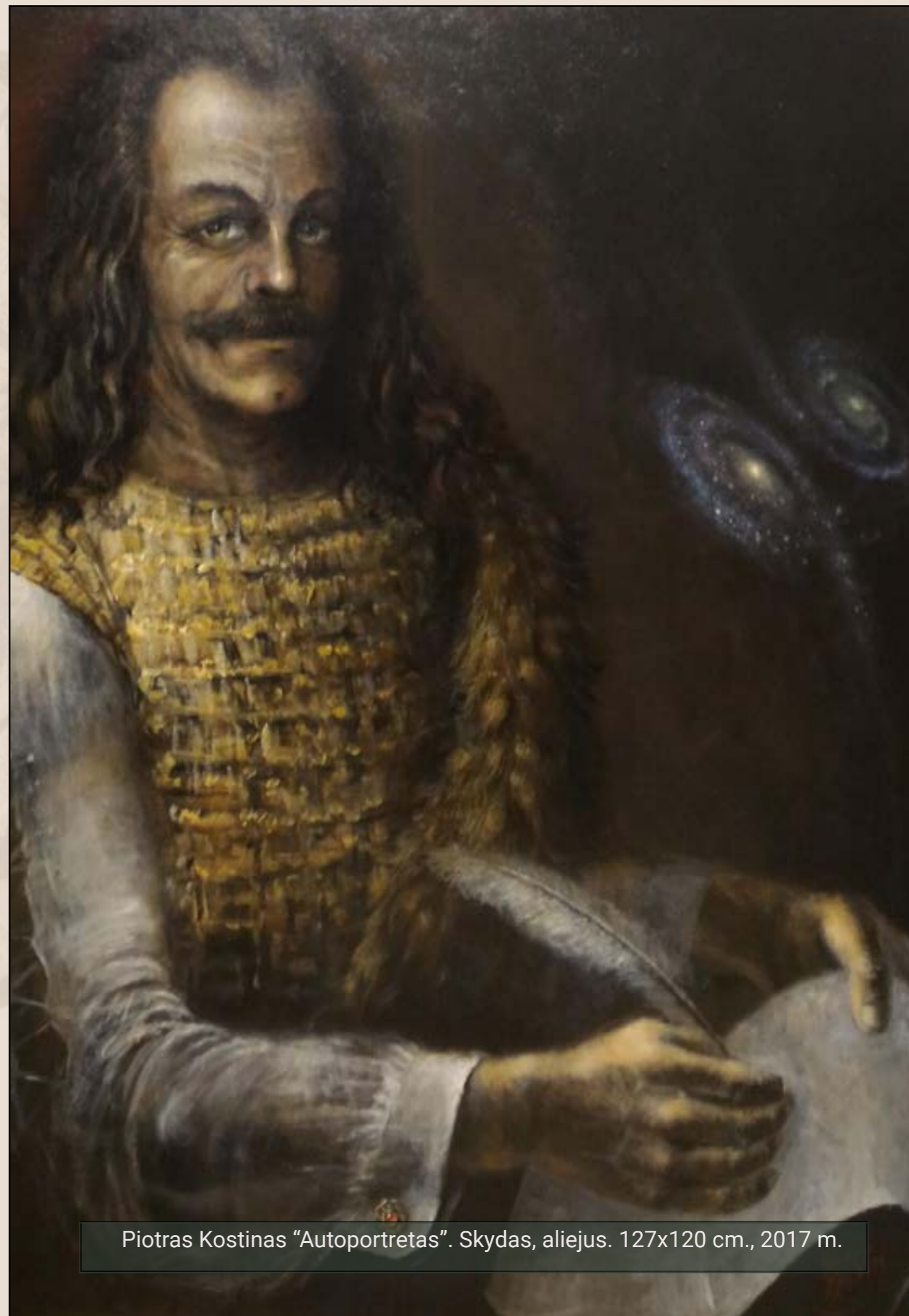
Piotras Kostinas "Autoportretas". Skydas, aliejus. 127x120 cm., 2017 m.